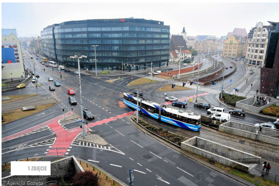
W centrum Wrocławia będzie strefa czystego transportu? (TOMASZ PIETRZYK)

Mateusz Kokoszkiwicz 21 stycznia 2020 | 06:38